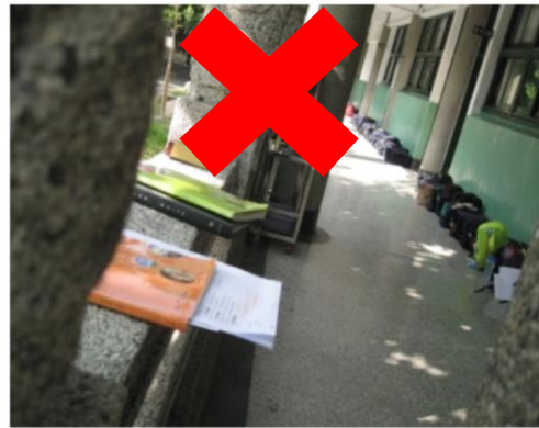
欄杆上不可放置物品