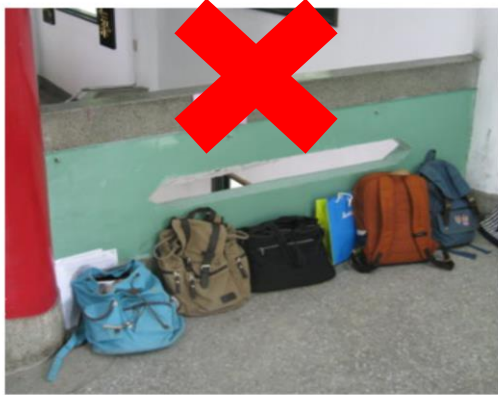
中間穿堂不可放置物品