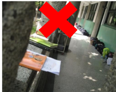
欄杆上不可放置物品